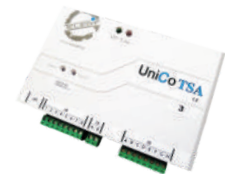
Teleallarmi TELEDIF ITALIA